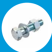
PARAFUSO SEXTAVADO INOX M10