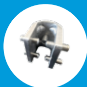
CLAMP ATLAS SAFE