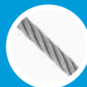
CABO DE AÇO