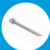
HASTES ROSCADAS M12 INOX