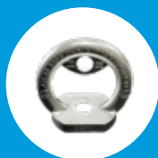
ORB ANCHOR ATLAS SAFE