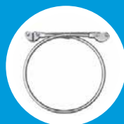
ABSORVEDOR DE ENERGIA LOOP