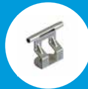
INTERPASS ATLAS SAFE