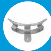
INTERMEDIÁRIA CURVA 90°